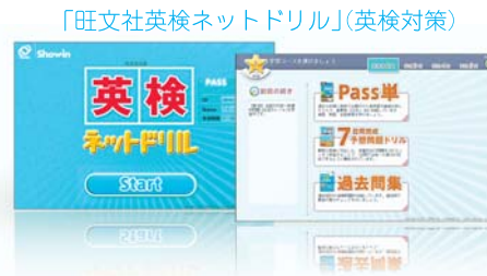
「旺文社英検ネットドリル」(英検対策)